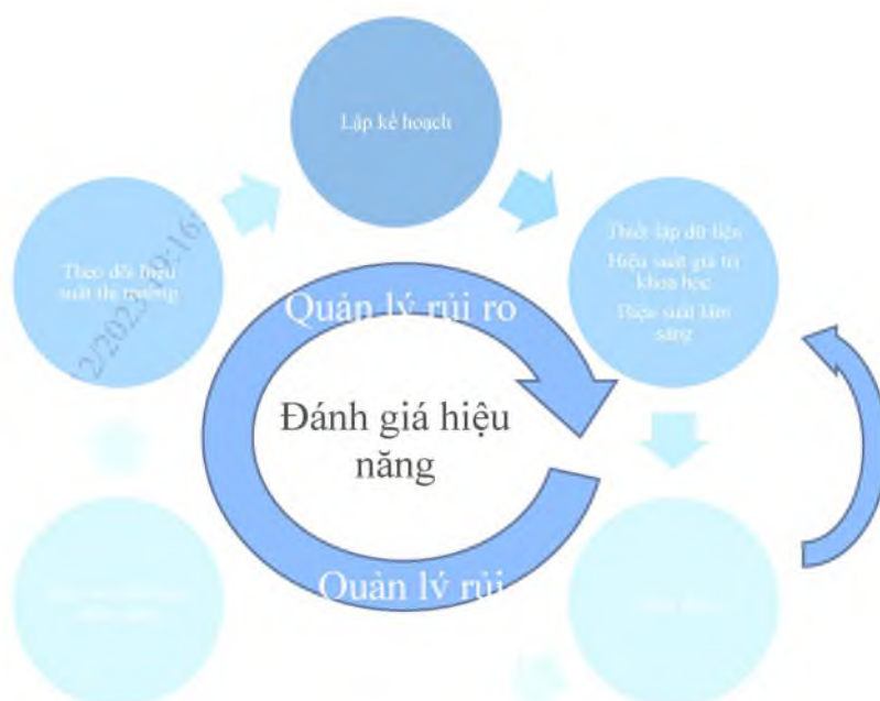
Hình 1. Tổng quan về đánh giá hiệu năng